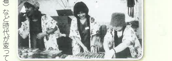
平成12年 港まつり ピアガーデン