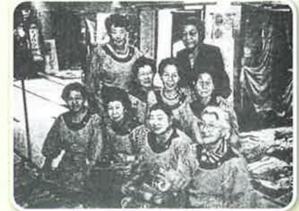
平成4年 フクシ巧匠展にて(衣料販売)

衣料販売 大変でも、金作りも、会の資金の源です。花の会」の名称も「白梅会」より四度変わって現在の「風花の会」です。