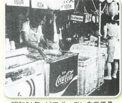
昭和61年 ピアガーデン自営風景