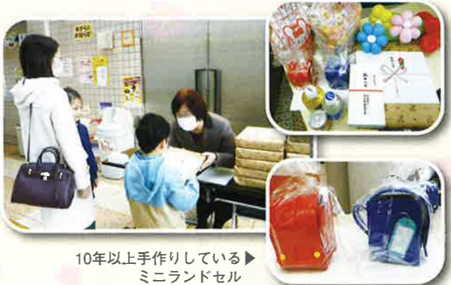
10年以上手作りしているミニランドセル

新型コロナウイルス感染症拡大防止の為に中止になってしまいましたが、対象の方々に3月1日に活動センターに来ていただき、記念品、紅白まんじゅう、バルーンアートのお花など、たくさんのプレゼントをお渡しする事ができました。受け取りに来てくださった方々のマスク姿が印象的でした。