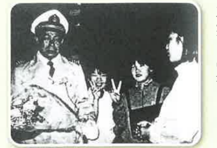
平成元年 フェリー見学旅行(操舵室体験)

衣料販売 大変でも、金作りも、会の資金の源です。花の会」の名称も「白梅会」より四度変わって現在の「風花の会」です。