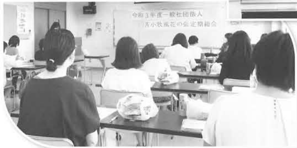
令和3年度一般社団法人 苫小牧風花の会 定期総会