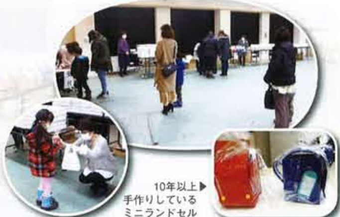
10年以上 手作りしている ミニランドセル

コロナウイルス感染拡大防止の為、会は中止になってしまいましたが、ソーシャルディスタンスに心掛け、記念品・紅白まんじゅう・バルーンアートの花束など、たくさんのプレゼントをお渡しする事ができました。受け取った子ども達が照れながら満面の笑顔で「ありがとう」と言ってくれて、私達も嬉しくなりました。