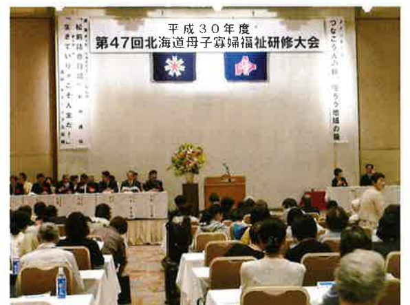
平成30年度 第47回北海道母子寡婦福祉研修大会

七月二十九日北海道母子寡婦福祉研修大会が帯広で開催され参加して来ます。講演「松前語日記」と歌「生きていりゃこそ人生だ」で笑いや手拍子で会場を魅了し、昼食・休憩時間では、帯広市郷土芸の和太鼓で腹の底から響き渡る力強い演奏に会場は拍手喝采でした。午後部の研修討議では、介護福祉士・ケアマネジャーの資格を取得し、デイサービスを起業した「私の自立」会の学習支援事業の取り組み「ひとり親家庭学習支援事業土曜スクール」の取り組みの発表があり、その後の行政説明では本道のひとり親家庭の現状、子育て支援や給付金を活用しての資格取得等説明をフロアエクター使用で分かり易く説明して下さいました。