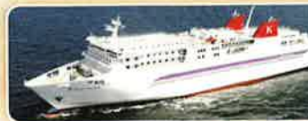
新造船「シルバーティアラ」で出発